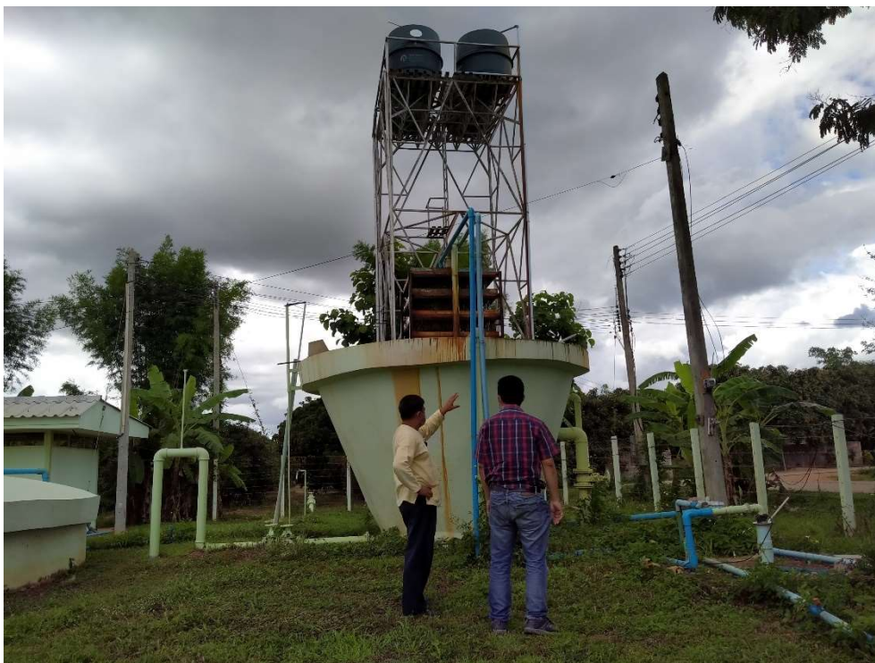
ภาพประกอบการเก็บรวบรวมข้อมูลโครงการขุดเจาะบ่อบาดาล