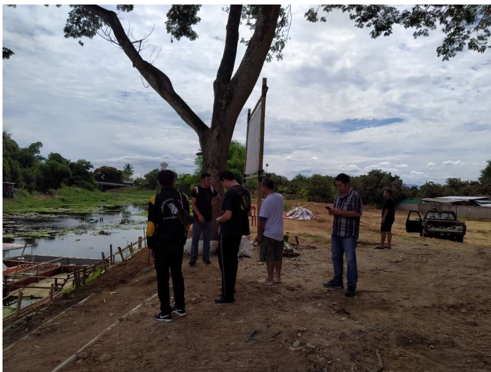
ภาพประกอบการเก็บรวบรวมข้อมูลโครงการจัดซื้อกล่องเก็บน้ำเพื่อใช้ป้องกันและบรรเทาสาธารณภัย