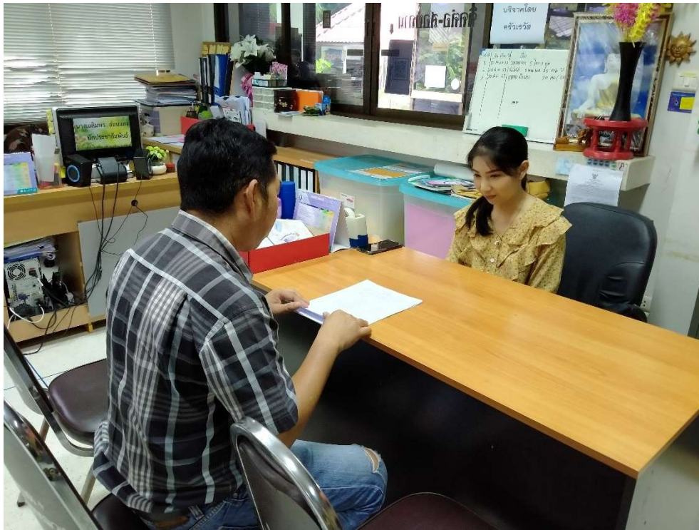
ภาพประกอบการเก็บรวบรวมข้อมูลโครงการไม้แกะสลักและของดีอำเภอมะนัง