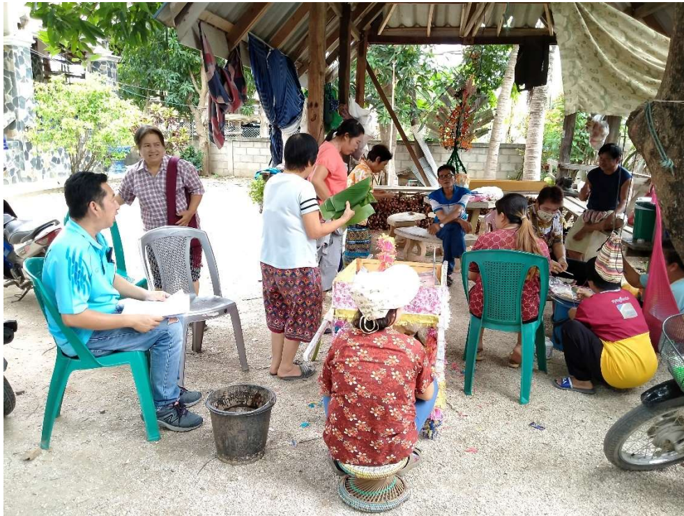
ภาพประกอบการเก็บรวบรวมข้อมูลโครงการชุดลอกคลองสาธารณะ