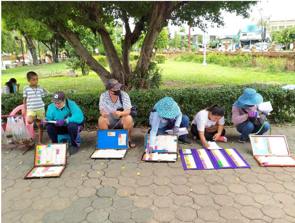
ภาพประกอบการเก็บรวบรวมข้อมูลโครงการจัดงานพระนางจามเทวี (พระแม่หนังเมือง)