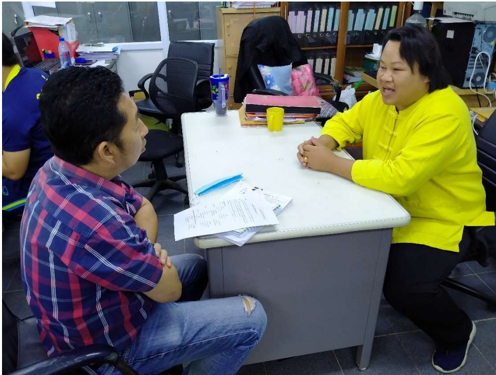
ภาพประกอบการเก็บรวบรวมข้อมูลโครงการเทศกาลปลาอะต้อ