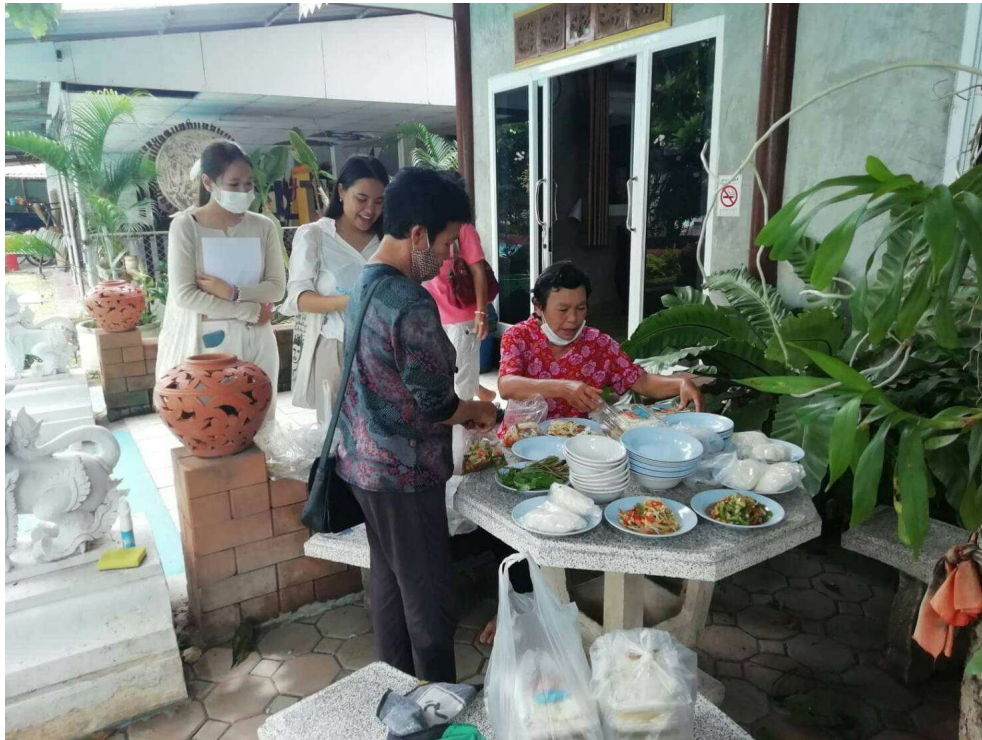
ภาพประกอบการเก็บรวบรวมข้อมูลโครงการขับเคลื่อนทุนทางวัฒนธรรมชุมชนจังหวัดลำพูน การจัดงาน เสน่ห์ทุนทางวัฒนธรรมชุมชนลำพูน ครั้งที่ ๑