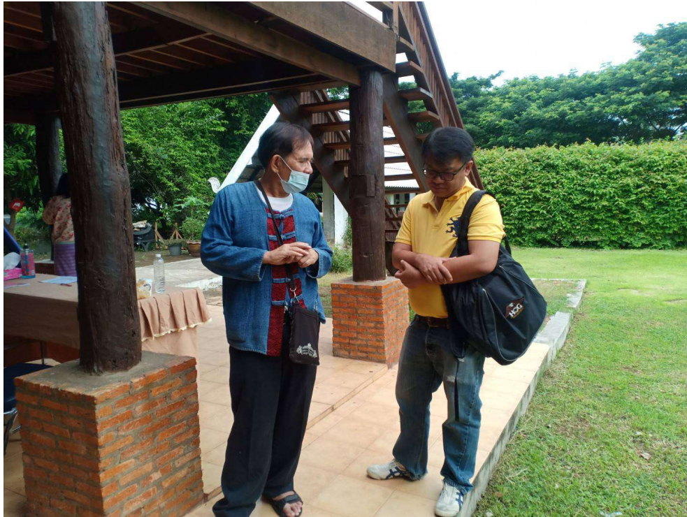
ภาพประกอบการเก็บรวบรวมข้อมูลทุนทางวัฒนธรรม