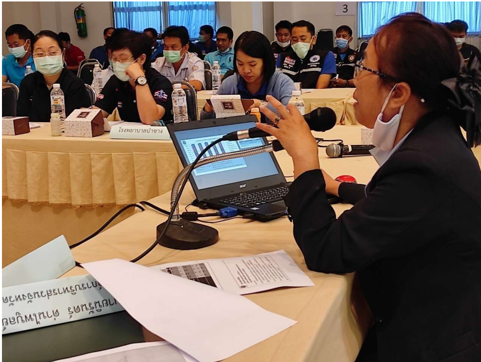
ภาพประกอบการเก็บรวบรวมข้อมูลโครงการพัฒนาศักยภาพผู้ปฏิบัติการการแพทย์ฉุกเฉินในจังหวัดลำพูน