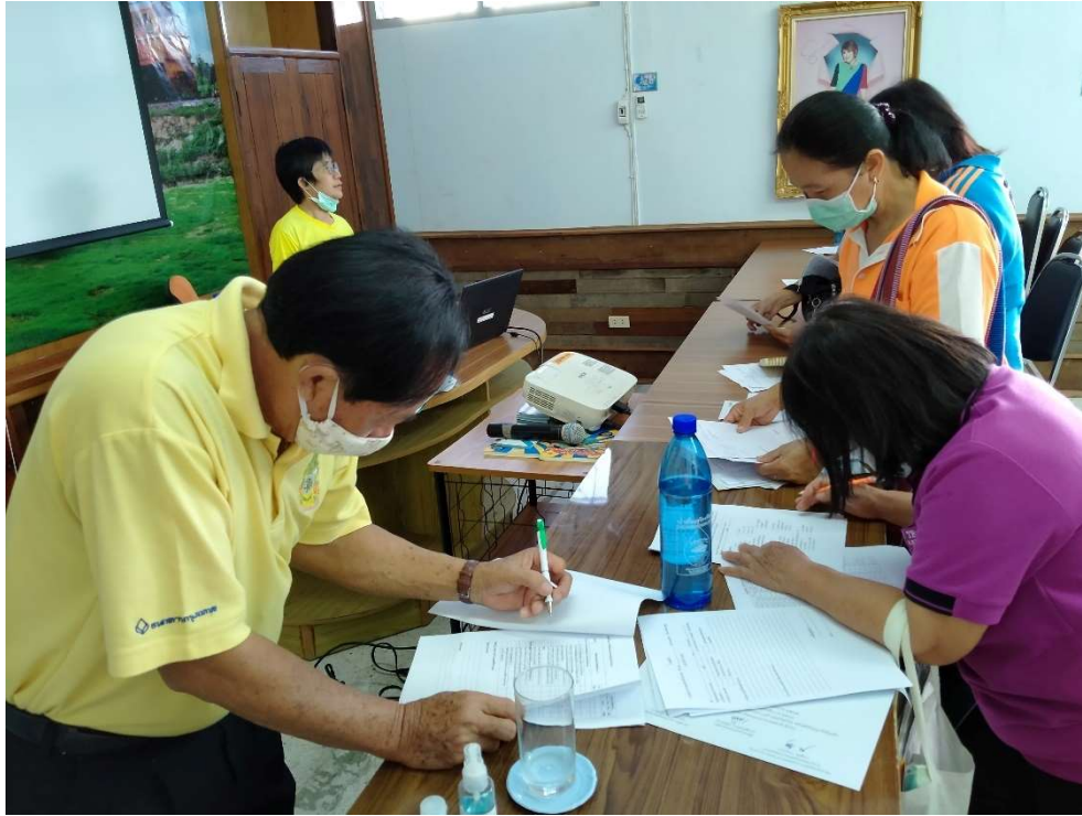
ภาพประกอบการเก็บรวบรวมข้อมูลโครงการพัฒนาศักยภาพบุคลากรด้านสาธารณสุข อสม. และผู้ที่เกี่ยวข้องแบบบูรณาการในจังหวัดลำพูน