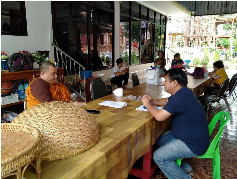
ภาพประกอบการเก็บรวบรวมข้อมูลโครงการส่งเสริมและพัฒนาแหล่งท่องเที่ยวตามวิถีเมืองเก่าลำพูน กิจกรรมการท่องเที่ยวเชิงวัฒนธรรม มหัทศจรีย์ที่ ๔ พระรอดมหาวัน เมืองลำพูน