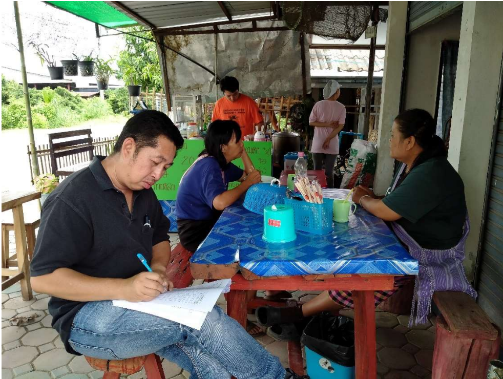
ภาพประกอบการเก็บรวบรวมข้อมูลโครงการวิถีชีวิตคนตำบลน้ำดิบกับไก่เหล่าน้าก้อย