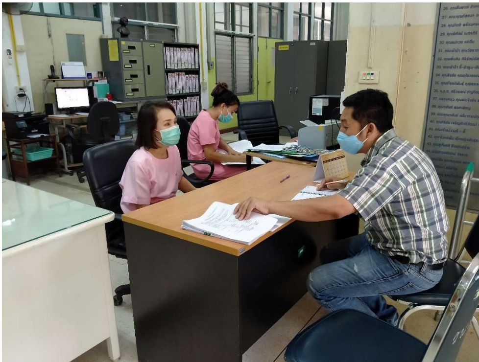
ภาพประกอบการเก็บรวบรวมข้อมูลโครงการความร่วมมือด้านสาธารณสุขในการให้บริการส่งเสริมสุขภาพ และรักษาพยาบาลผู้ป่วยโรคไต